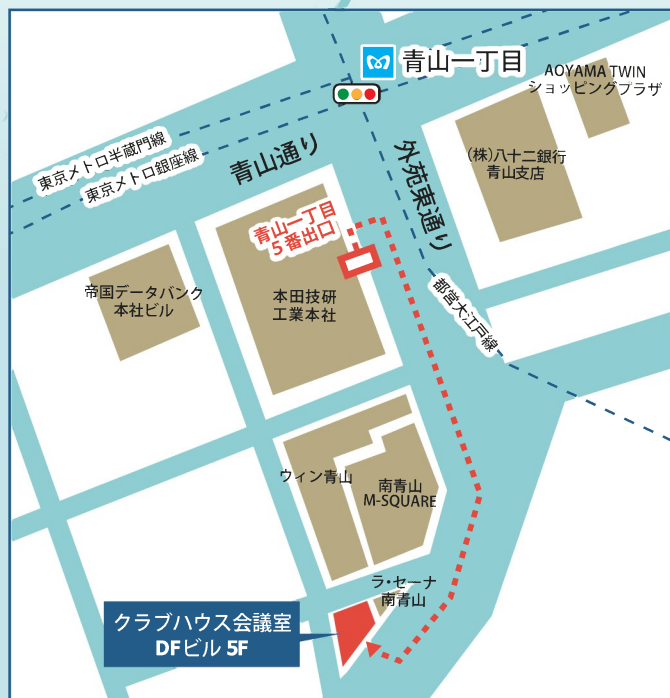
東京メトロ - 銀座線・半蔵門線・大江戸線青山一丁目駅 5番出口から徒歩2分

お問い合わせ・お申込み お申込みはメール、またはお申込み書記載の上、スタッフにお渡しください。